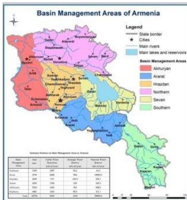
Рис. 1. Территории управления водными бассейнами Армении [АУВР, 2019а].

По территории страны протекает около 9 500 малых и больших рек общей протяжённостью 23 000 км. Водоёмы и водотоки Армении характеризуются типично горным режимом с резкими сезонными колебаниями, весенними паводками и маловодными летом [ФАО, 2008]. Озера Севан и Арпи являются наиболее важными с точки зрения размера и экономического значения. Севан – крупнейшее озеро Армении, расположенное на высоте 1 900 м над уровнем моря [ФАО, 2008] – является стратегическим источником воды для гидроэнергетической и сельскохозяйственной отраслей, равно как и играет важную гидрологическую роль. Кроме этого, озеро является знаковым местом отдыха, природной средой обитания многих видов и культурным ресурсом Армении.