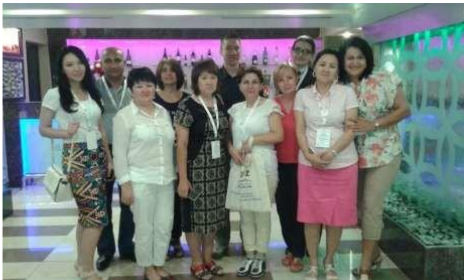
Фото 1. Рабочая встреча специалистов национальных гидрометеослужб стран ЦА в рамках проекта CAWa, Ташкент, 2016 г.